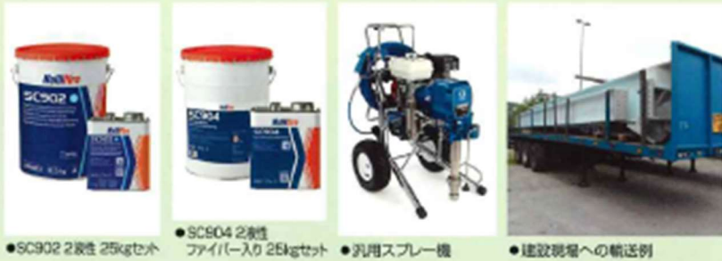
●SC902 2液性 25kgセット ●SC904 2液性ファイバー入り 25kgセット ●汎用スプレー機 ●建設現場への輸送例

ナリファイア・ハイブリッドベースコートは、速乾・厚膜塗料のため鉄骨組立工場での塗装が可能となり、建設現場での塗装工期が大幅に短縮されます。また、工場塗装により塗膜の厚みや仕上げ面の品質管理が容易です。現場では鉄骨継ぎ手部分やタッチアップのみの施工となります。