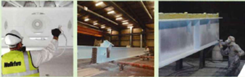
●塗装作業 ●工場塗装の例

塗装は汎用の高圧スプレー機が使用できるので、特殊な機材や特別な技術は不要です。(国交省認定品のため、作業者は施工技術の指導・認定を受ける必要があります。)