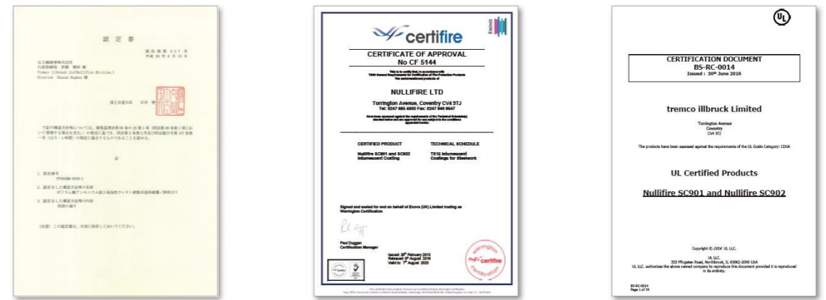
●国土交通省認定書 ●英国(欧州)認定書 ●米国認定書