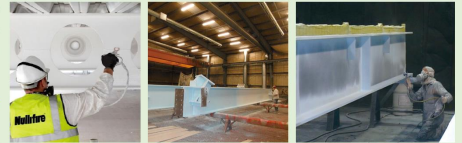
●塗装作業 ●工場塗装の例

塗装は汎用の高圧スプレー機が使用できるので、特殊な機材や特別な技術は不要です。(国交省認定品のため、作業者は施工技術の指導・認定を受ける必要があります。)