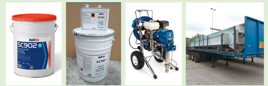
●SC902 25kg缶 ●上:硬化剤/下:主材 ●汎用スプレー機 ●建設現場への輸送例

ナリファイア・ハイブリッドベースコートは、速乾・厚膜塗料のため鉄骨組立工場での塗装が可能となり、建設現場での塗装工期が大幅に短縮されます。また、工場塗装により塗膜の厚みや仕上げ面の品質管理が容易です。現場では鉄骨継ぎ手部分やタッチアップのみの施工となります。